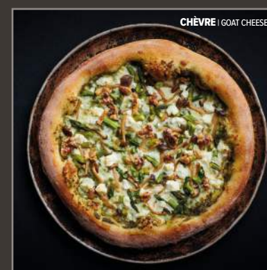
CHÈVRE | GOAT CHEESE