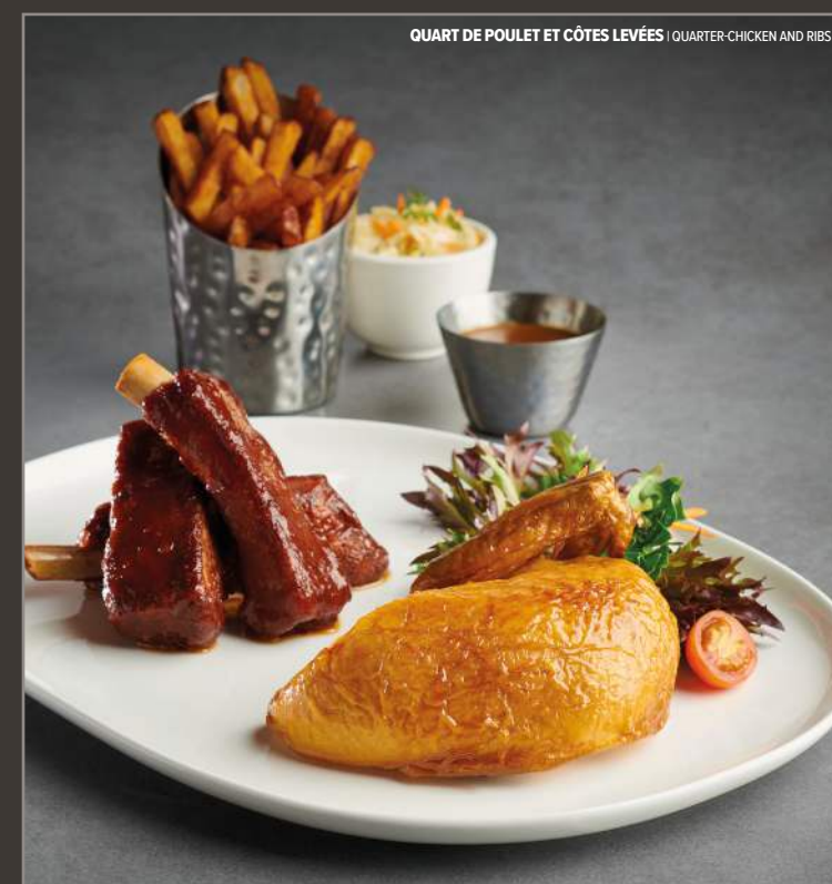
QUART DE POULET ET CÔTES LEVÉES | QUARTER-CHICKEN AND RIBS

Housemade tomato sauce, house cheese blend, pepperoni, bacon, bell peppers, sautéed mushrooms, onions, green olives