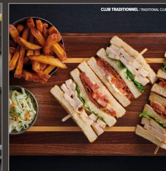
CLUB TRADITIONNEL | TRADITIONAL CLUB