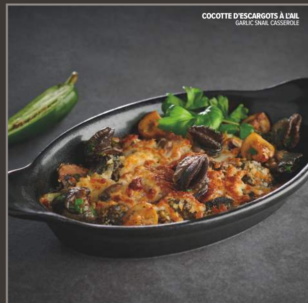
COCOTTE D'ESCARGOTS À L'AIL GARLIC SNAIL CASSEROLE