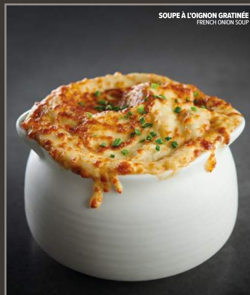
SOUPE À L'OIGNON GRATINÉE FRENCH ONION SOUP