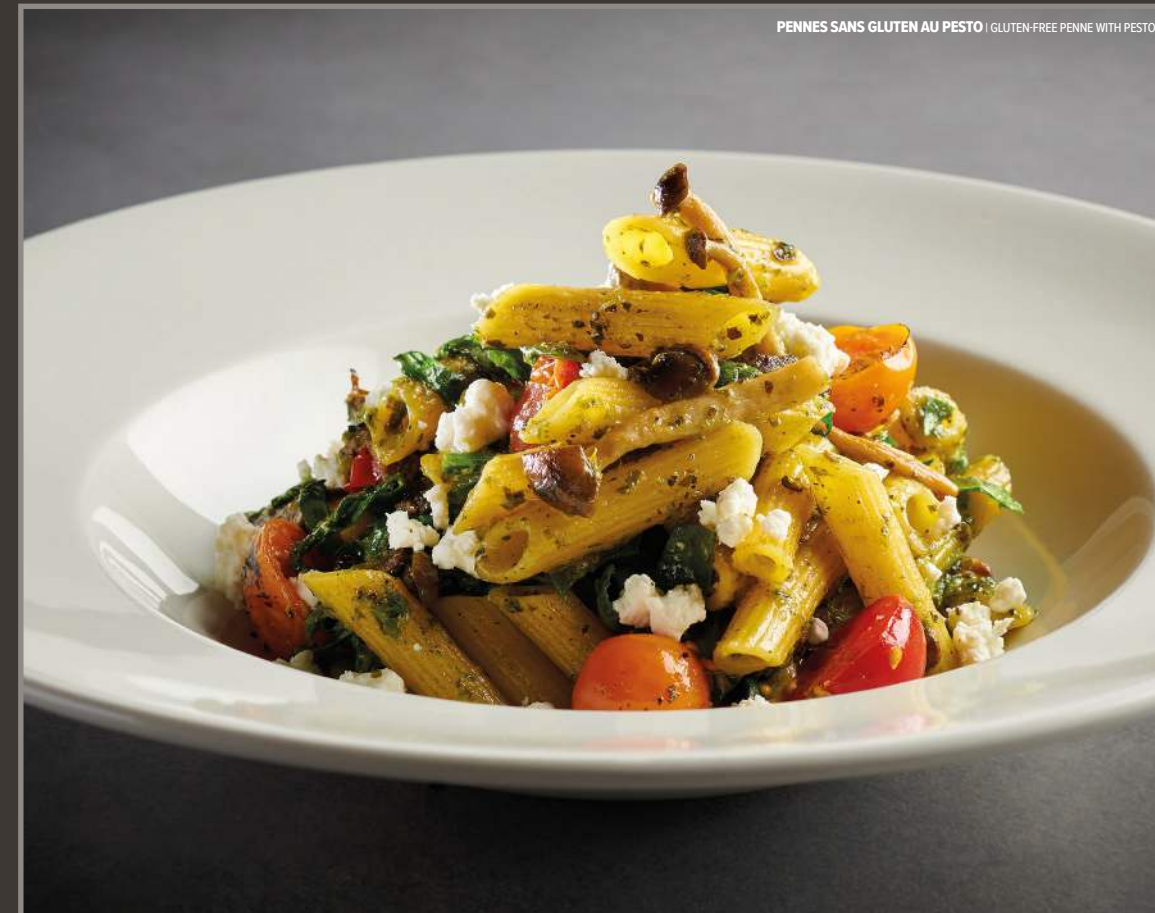
PENNES SANS GLUTEN AU PESTO | GLUTEN-FREE PENNE WITH PESTO