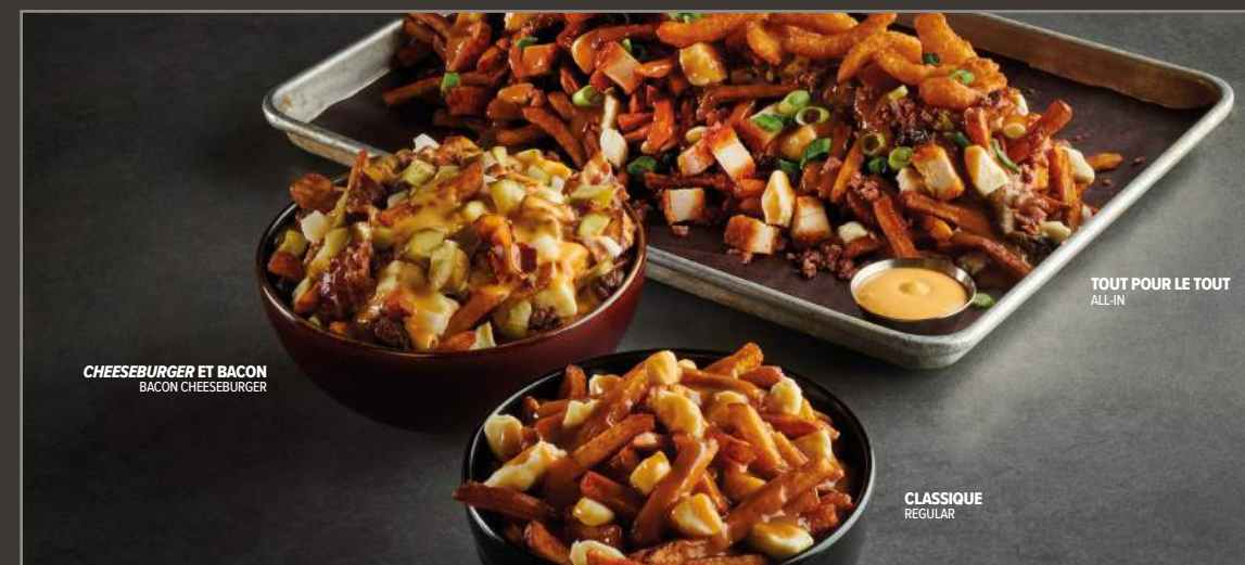
CHEESEBURGER ET BACON BACON CHEESEBURGER

1 kg of freshly cut fries, fried chicken, smoked meat, fried onions, sautéed mushrooms, spicy mayonnaise