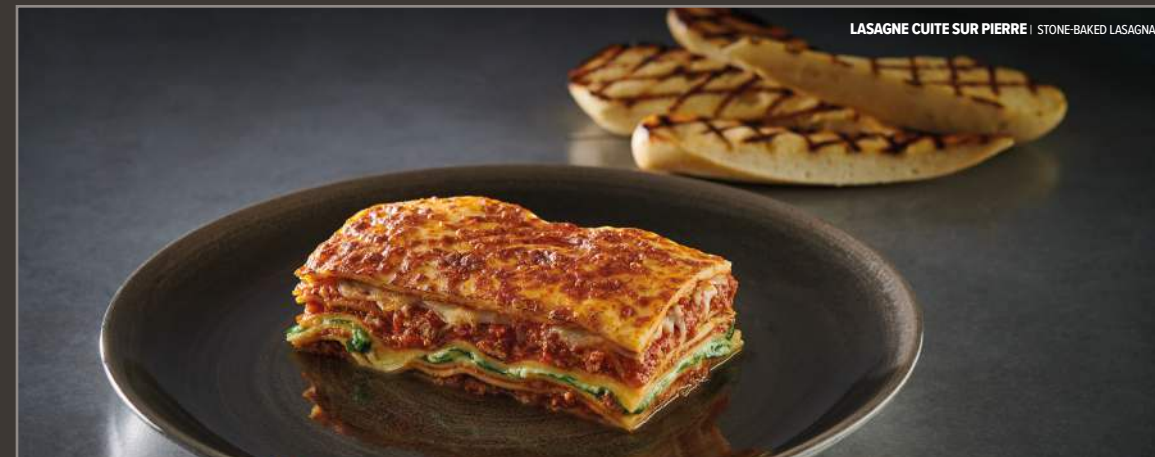
LASAGNE CUITE SUR PIERRE | STONE-BAKED LASAGNA

Contre-filet de bœuf grillé, crevettes géantes tempura (2), mayonnaise à la lime, jus de bœuf, frites fraîches Grilled beef striploin, tempura jumbo shrimp (2), lime mayonnaise, beef jus, freshly cut fries