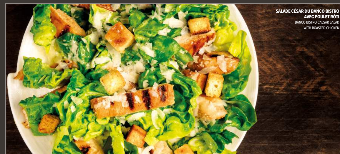
SALADE CÉSAR DU BANCO BISTRO AVEC POULET RÔTI BANCO BISTRO CAESAR SALAD WITH ROASTED CHICKEN

Avec poulet rôti +5,50 With roasted chicken