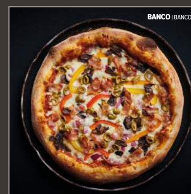
BANCO | BANCO