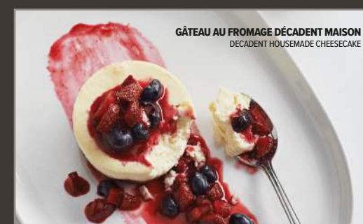
GÂTEAU AU FROMAGE DÉCADENT MAISON DECADENT HOUSEMADE CHEESECAKE