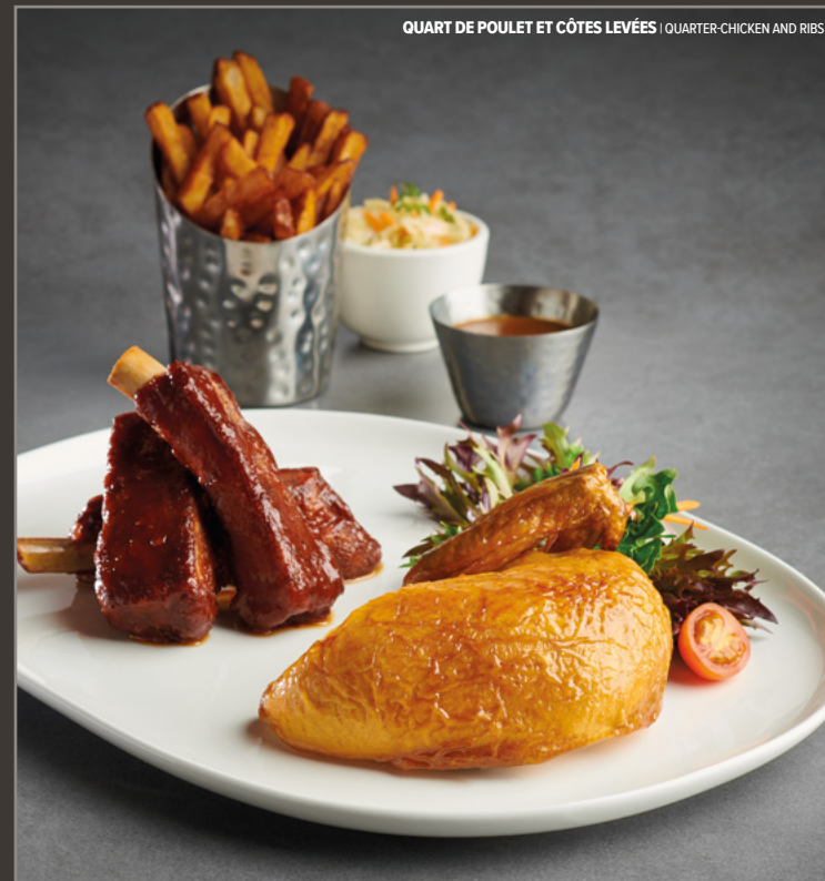
QUART DE POULET ET CÔTES LEVÉES | QUARTER CHICKEN AND RIBS

Housemade tomato sauce, pepperoni, bacon, bell peppers, sautéed mushrooms, onions, green olives