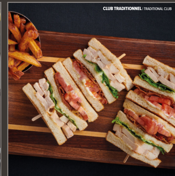
CLUB TRADITIONNEL | TRADITIONAL CLUB