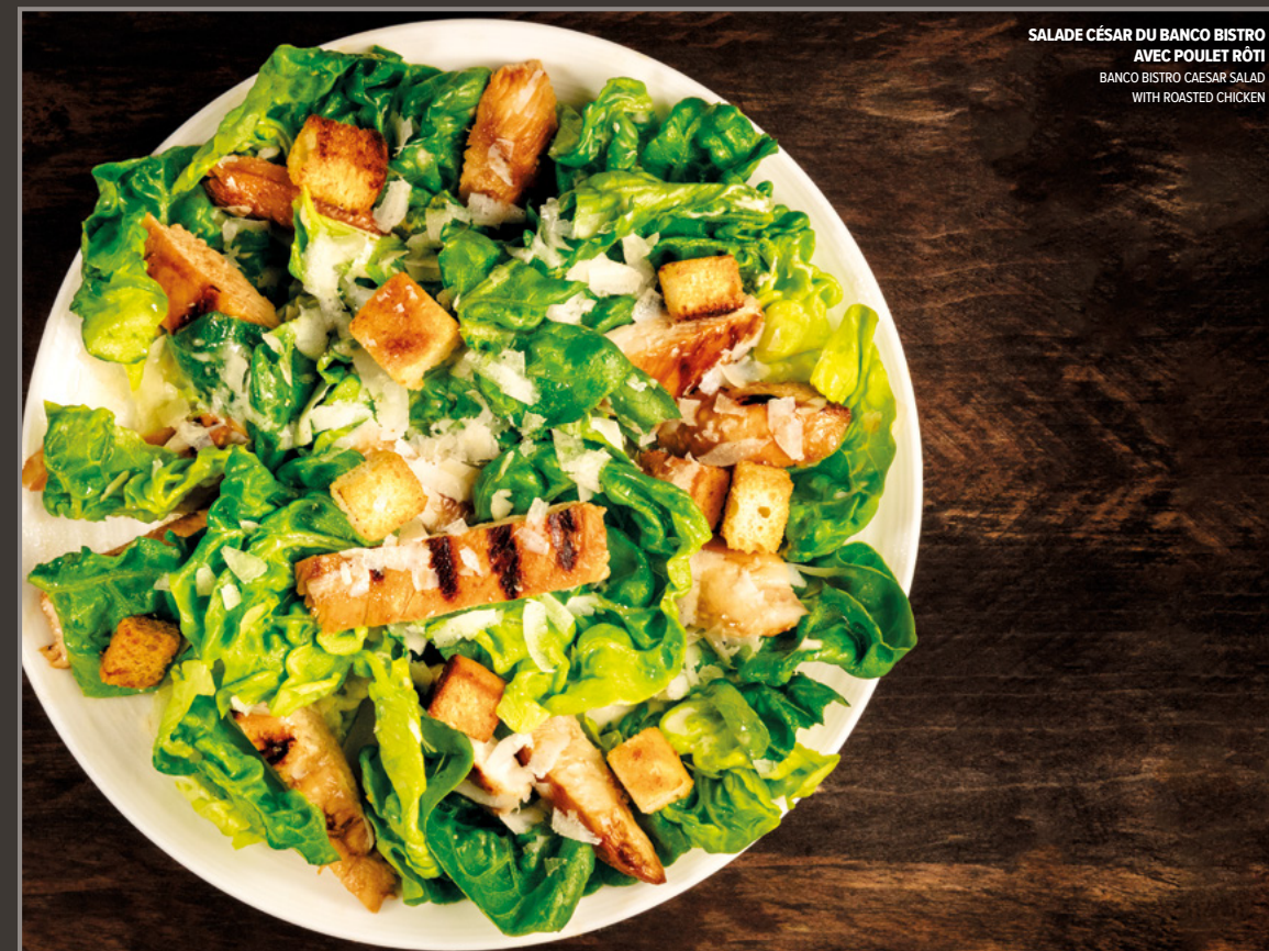
SALADE CÉSAR DU BANCO BISTRO AVEC POULET RÔTI BANCO BISTRO CAESAR SALAD WITH ROASTED CHICKEN

Avec sauce au choix : barbecue ou piquante With your choice of sauce: barbecue or spicy