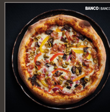
BANCO | BANCO