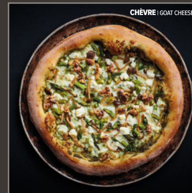
CHÈVRE | GOAT CHEESE