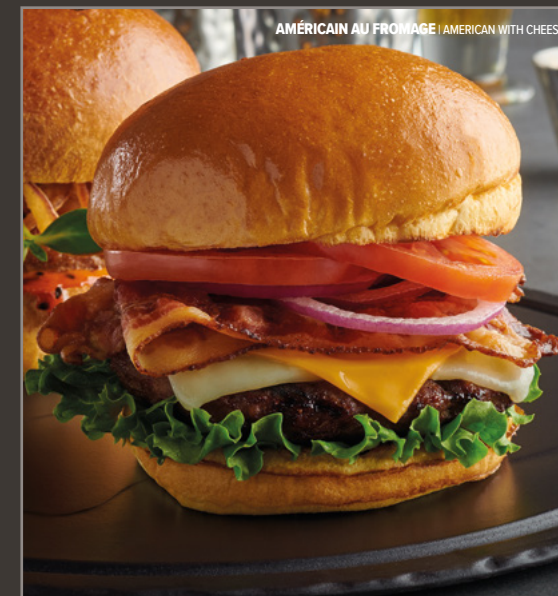
AMÉRICAIN AU FROMAGE | AMERICAN WITH CHEESE

Angus beef, sautéed mushrooms, caramelized onions, lettuce, tomatoes, Brie, Dijon sauce